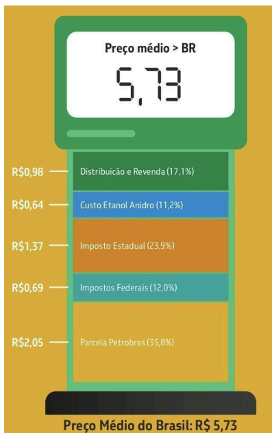
Figura 2 - Formação do preço médio da gasolina